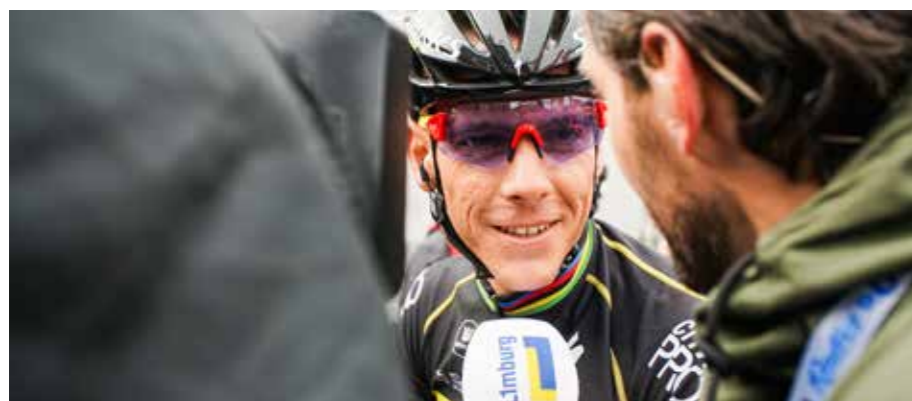
Philippe Gilbert en de Amstel Gold Race.

Het bereik van L1 Radio is in 2017 met bijna 3% punten gedaald ten opzichte van 2016, ofwel van 14,1% marktaandeel in 2016 naar een jaargemiddelde van 11,2% in 2017. Doel was en is 14% marktaandeel en 2e positie in Limburg. Opvallend is dat de sterkere radioprogramma's op zaterdag en zondag nu ook terrein verliezen.