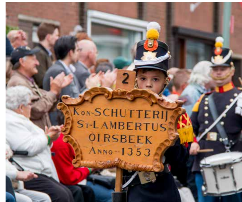
Oud Limburgs Schuttersfeest.

Vanwege de vele onzekerheden was het niet mogelijk om in 2017 een nieuwe media-opdracht op te stellen voor de periode 2017-2022. In 2018 zal een nieuwe media-opdracht worden opgesteld. De nieuwe media-opdracht moet daarbij afgestemd zijn op het Concessiebeleidsplan voor de regionale omroepen zoals dat door de RPO is opgesteld.