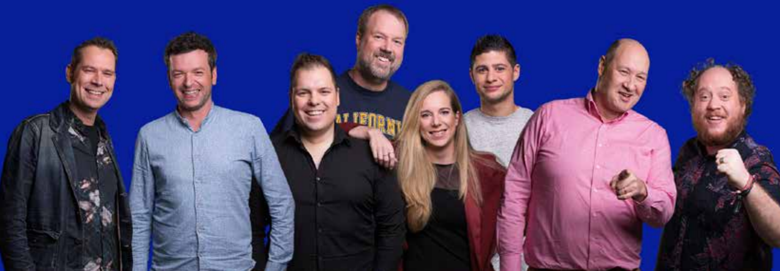
Radiopresentatoren van L1.